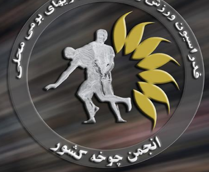
خراسان شمالی (اسفراین) مسابقات جوخه کشوری ۱۴ فروردین ۹۵