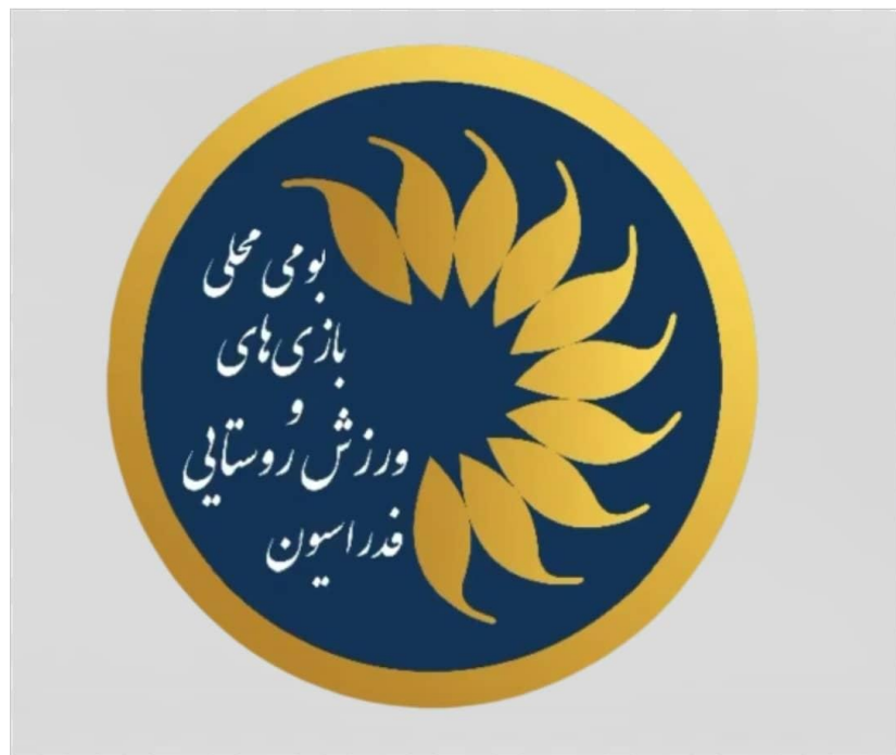
فدراسیون ورزش و روستایی و بازی‌های بومی و محلی

در پایان برای کلیه داوران کشتی باچوخه که یکی از مظلومترین افراد در گودها و میادین مسابقات هستند و در پاکی و سلامت آنها هیچ شک و شبهه‌ای وجود ندارد، آرزوی سلامتی و موفقیت می‌کنیم.